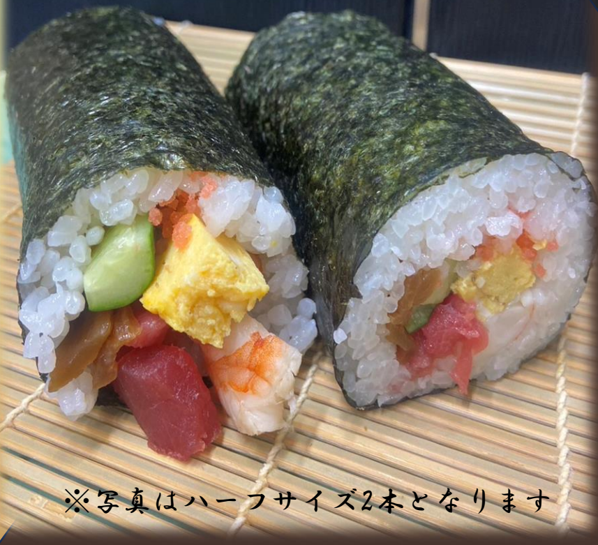
※写真は-halfサイズ2本となります